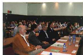
Jornades Forestals del Centre de la Propietat Forestal, dedicades a l'Any Internacional dels Boscos.

Enguany s'han editat, en format digital, els cinc primers manuals nascuts dins del projecte ORGEST.