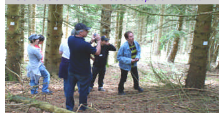
Utilisation du martéloscope JL Mabboux

Partenaires français : Office national des forêts, SIEM-Syndicat Intercommunal des Eaux des Moises, SM3A-Syndicat Mixte d'Aménagement de l'Arve et de ses Abords, CCCL-Communauté de Communes des Collines du Léman, Communauté d'Agglomérations CHAMBERY METROPOLE